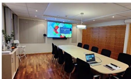
Leto - Grupprum