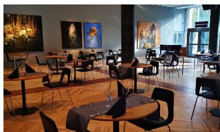
Kulturbaren - Lounge & Eventlokal