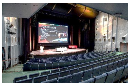
Hebeteatern - Teater & Föreläsningssal