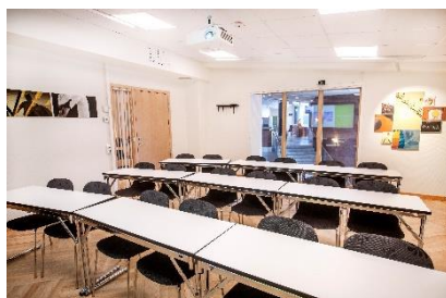
Pan - Mötesrum