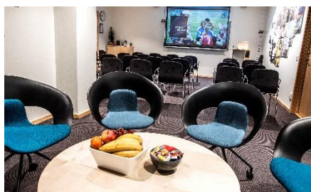
Eos - Mötesrum