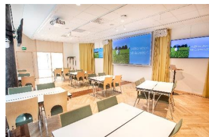
Atlas - Mötesrum & Studio