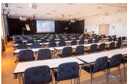
Clio - Konferensrum/Eventlokal