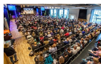
Apollon/Bacchus - Middags- & Eventlokal